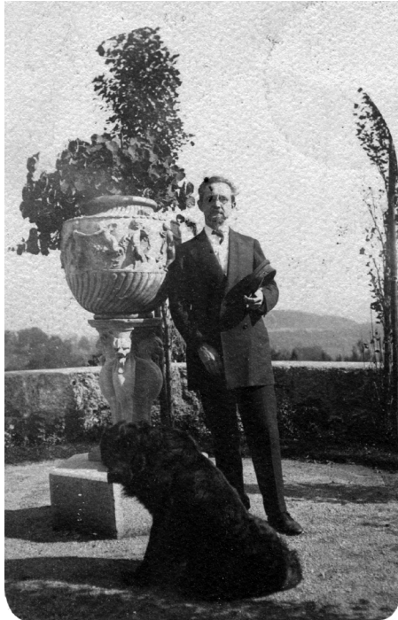
Abb. 3: Postkarte mit Fotografie Werner Sombart