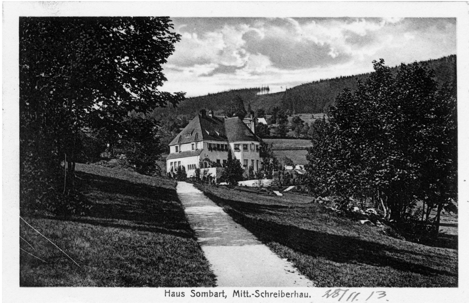
Abb. 2: Postkarte mit Motiv Haus Sombart, Mitt.-Schreiberhau