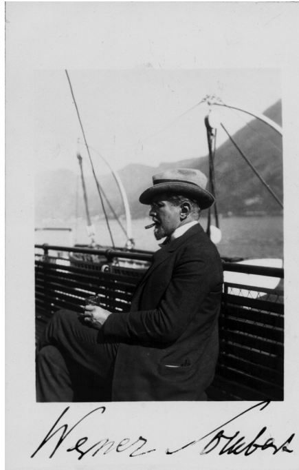
Abb. 4: Fotografie von Werner Sombart